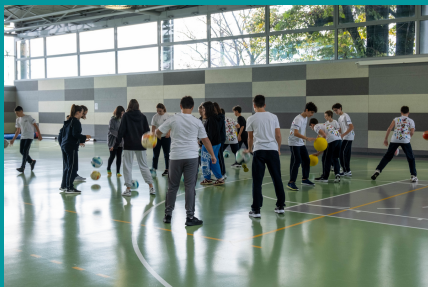
LA NOSTRA PALESTRA